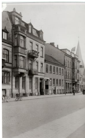
Arkivets första lokaler i Folkets hus, ovanför burspråket, till vänster i bilden. 1955.

Efter att Arkivet fått sina lokaler i Folkets hus fjärde våning 1947, inleddes ett första arbete med att insamla och förteckna det inkomna materialet. Från detta år började föreningen också att ta emot anslag från drätselkammaren för sin verksamhet, vilket har fortsatt fram till idag. Redan tidigt i föreningens historia riktade man sig också utåt mot stadens befolkning och i verksamhetsberättelsen för 1950 beskrivs hur besökarna började dyka upp. Två år senare menade Arkivet själva att de ”fyller ett viktigt behov inom arbetarrörelsen i Landskrona”. På grund av att materialet fortsatte komma in och besöken ökade var Arkivet 1961 i behov av en större lokal och flyttade ner i källaren i Folkets hus. Arbetet fortsatte och trots ihärdiga försök från Arkivets håll lyckades man inte med den inledande önskan att få total anslutning av den organiserade arbetarrörelsen, vilket 1963 benämndes som ett misslyckande. Arkivet