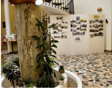
Utställning "Nostalgi" i ljussalen utanför dagens lokaler.

Under slutet av 1950-talet och början 1960-talet ökade antalet personer som intresserade sig för Arkivets material. Bland annat studenter och forskare från Lunds Universitet började hitta hit. 1965 såg Arkivet